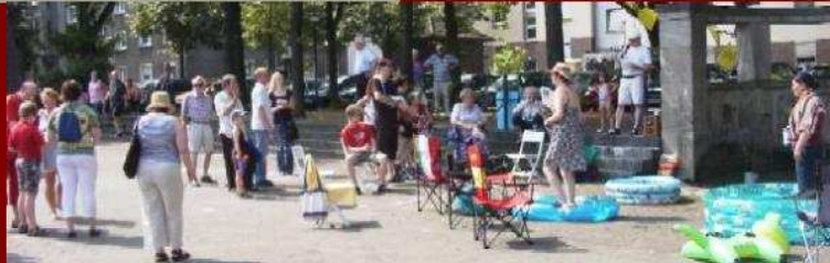
Viele Kinder – wenig Wasser. Angesichts der sommerlichen Temperaturen wirkt sich die Schließung der Oase nun noch stärker aus.

Man muss sich immer wieder etwas neues einfallen lassen, um das Interesse der Medien zu wecken.