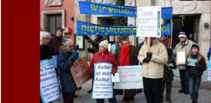
Demonstration in Frohnhausen am 13. März 2010